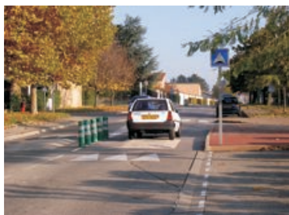
Rue de distribution du quartier