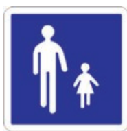
B54 Entrée d'une aire piétonne