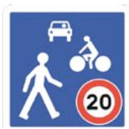
B52 Entrée d'une zone de rencontre