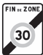
Panneau B51 Sortie d'une zone 30

La fin de la zone 30 peut être annoncée par un des panneaux suivants :