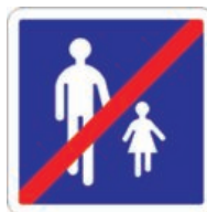
B55 Fin d'aire piétonne

La fin de l'aire piétonne peut être annoncée par un des panneaux suivants :