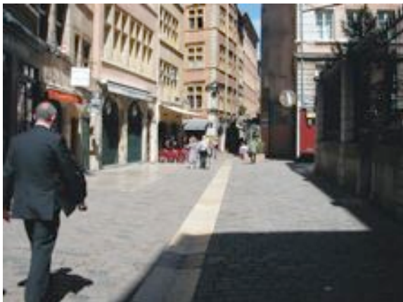
Rue piétonne quartier ancien