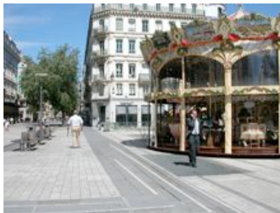
Organisation d'espaces dédiés au repos ou au jeu au sein d'une aire piétonne

Par ailleurs, il est possible de prévoir à l'intérieur des aires piétonnes des espaces dédiés à la pratique de certaines activités telles que des aires de jeu (que ce soit pour enfant ou pour adulte, par exemple des tables pour les jeux de société...). Il est conseillé d'aménager des espaces de repos pour tenir compte du vieillissement de la population et de la nécessité pour certains piétons de trouver des lieux où faire étape, même pour des déplacements de quelques centaines de mètres.