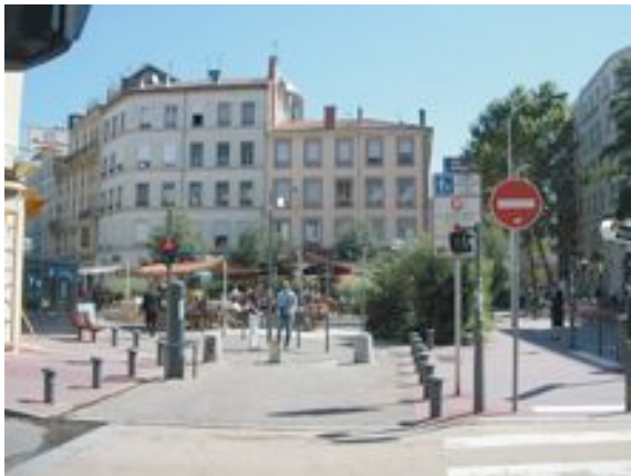
Régulation d'entrée d'aire piétonne

Pour la signalisation, comme il est de règle en milieu urbain, le recours au marquage au sol et à la signalisation de type routier est à éviter.