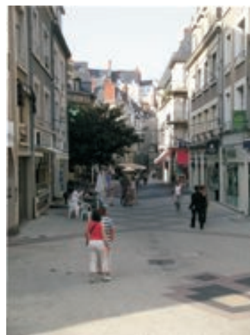
Rue commerçante