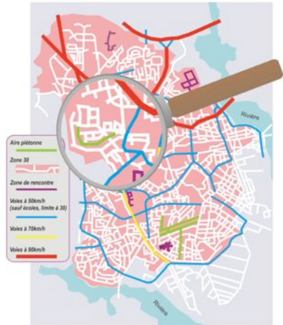
Plan théorique d'un réseau de voirie hiérarchisé

Elle est adaptée aux lieux qui présentent une forte densité de piétons (hyper-centre, lieux culturels, commerciaux, etc.), ou pour lesquels on souhaite créer un espace où l'on privilégiera l'absence de véhicule motorisé pour mener des activités qui cohabitent difficilement avec ceux-ci.