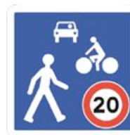
B52 Entrée d'une zone de rencontre