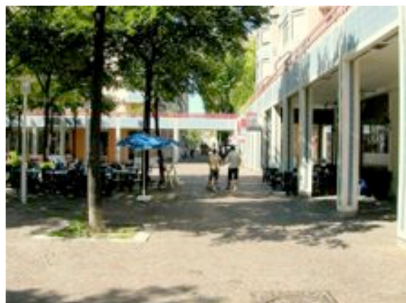
Organisation des occupations de l'espace public pour dégager un cheminement piéton

Par ailleurs, il peut être tentant de profiter de l'espace public dégagé de la circulation motorisée pour multiplier les autorisations d'occupation de cet espace notamment pour les commerces (terrasses de café, étalages, panneaux publicitaires, ...). Ces occupations font l'objet d'une autorisation auprès de la mairie et celle-ci devra veiller à délimiter clairement ce qui est compatible avec le cheminement libre de tout obstacle et s'assurer un contrôle régulier de l'occupation de l'espace public. En effet, dans tous les cas, on veillera à ne pas mettre d'obstacle au déplacement des piétons sur le cheminement privilégié (cf. personnes à mobilité réduite).