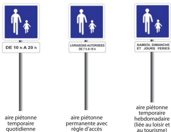
aire piétonne temporaire quotidienne