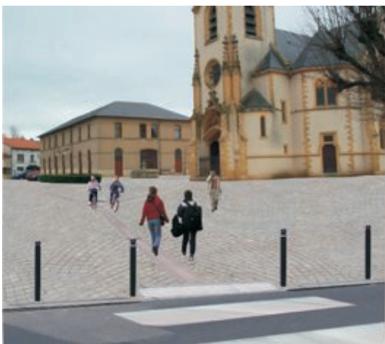
Grand parvis