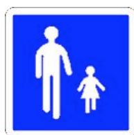
Panneau B54 Entrée d'une aire piétonne

Le choix d'un panneau montrant explicitement deux piétons, un adulte et une fillette, vise à exprimer la priorité du piéton et le fait que l'espace lui est réservé.