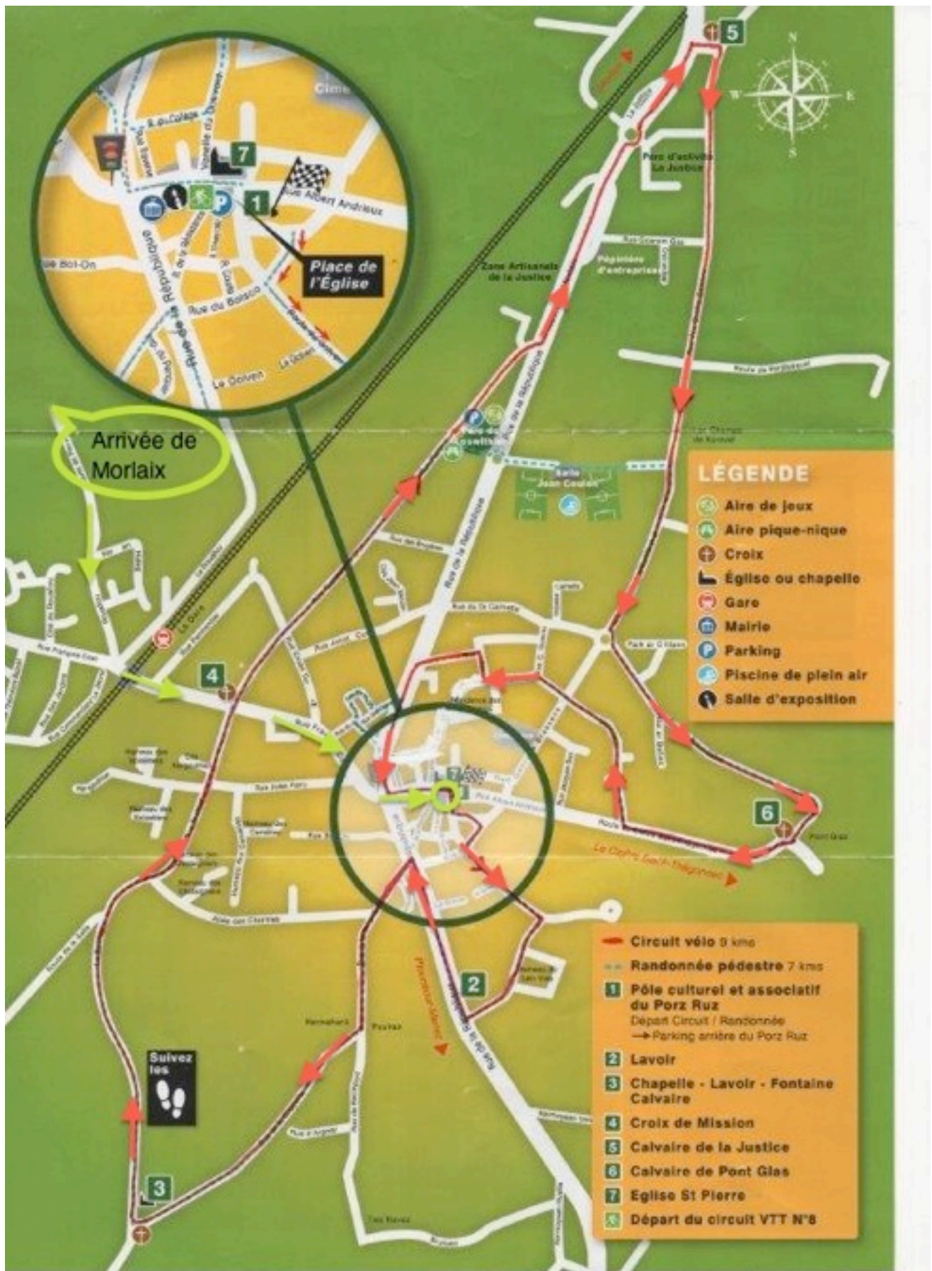
Plan du bourg de Pleyber-Christ avec, en trait rouge, la boucle de découverte cyclo réalisée.